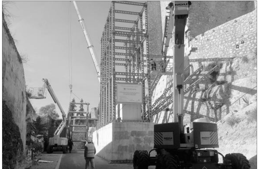
■ Els operaris retiren totes les bigues de ferro que subjectaven la muralla restaurada el 2006.

Aquesta estructura metàl·lica de grans dimensions es va instal·lar a finals de 2005 com una actuació prèvia a la rehabilita-